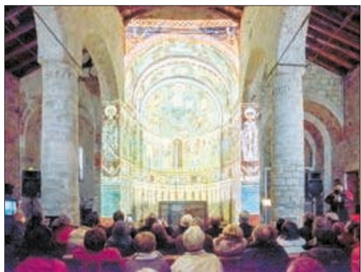
Mostraran el video-mapping de Sant Climent

Vilaller s'incorpora al moviment Viles Florides, que ja suma 75 municipis a tota Catalunya així com més de 200 llars i espais públics al llarg de tot el territori. Viles Florides és una iniciativa de la Confederació d'Horticultura Ornamental de Catalunya (CHOC) que promou la transformació de racons, pobles i ciutats de Catalunya a través de la flor i la planta ornamental. El projecte busca posar en valor la protecció dels espais verds i la millora de la qualitat de vida.