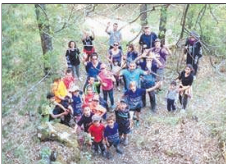
Les activitats volen promoure l'excursionisme entre els nens

El Club Excursionista de Vilaller és un dels més actius del Pirineu i organitza importants esdeveniments esportius a les muntanyes de l'entorn ribagorçà, alguns en solitari i altres amb la col·laboració d'altres clubs, entitats i la Fe-