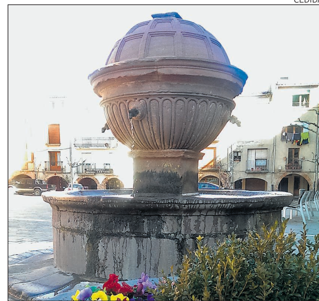
El municipi cuida cada detall dels seus espais urbans.

Viles Florides vol reconèixer la riquesa natural i paisatgística del país mitjançant el reconeixement públic de tots aquells projectes d'enjardinament, or-