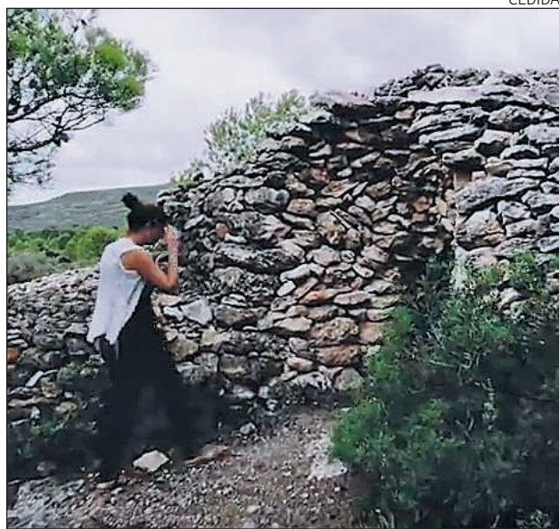
Una de les barraques de pedra seca de Mont-roig del Camp.

Les construccions de pedra seca, com ara barraques, marges, cisternes, paravents, carre-