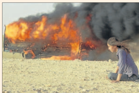
Un fotograma d'Incendis, el film que obre el cicle.

Quaderns de viatge és el nou cicle de cine que avui estrena CaixaForum, que inclou una selecció de quatre films units pel denominador comú de ser una metàfora entre el fet de viatjar i viure, entre una destinació incerta i una dubtosa tornada. Són Incendis , Hacia rutas salvajes , Peregrinos i Cerezos en flor . Obre Incendis , dirigida el 2010 per Denis Villeneuve, un relat sobre dos bessons que, després de la mort de la mare, busquen al Líban la resposta a les incògnites que els ha llegat.